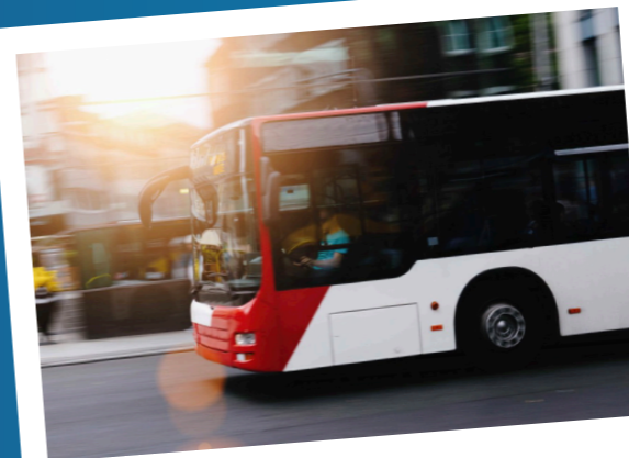
Freies Bahn- & Busfahren

Dein Zugang zu Fitnessstudios, Schwimm- und Freizeitbäder, Kletter- und Boulderhallen und vieles mehr