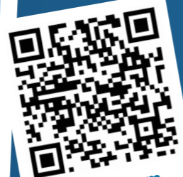
Zu unserem Firmen Video