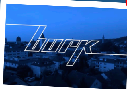
Handwerk made in Oberschwaben